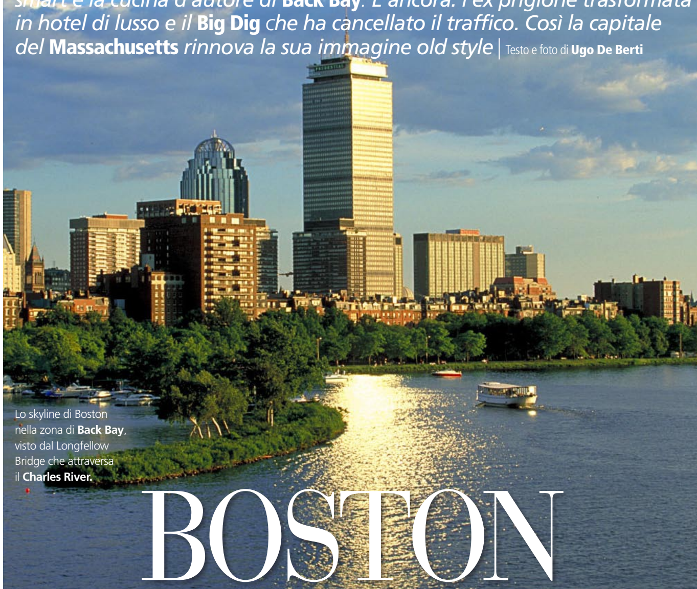
Lo skyline di Boston nella zona di Back Bay , visto dal Longfellow Bridge che attraversa il Charles River .

I brunch e la scena artistica di South End. Le gallerie di design, lo shopping smart e la cucina d'autore di Back Bay. E ancora: l'ex prigione trasformata in hotel di lusso e il Big Dig che ha cancellato il traffico. Così la capitale del Massachusetts rinnova la sua immagine old style | Testo e foto di Ugo De Berti